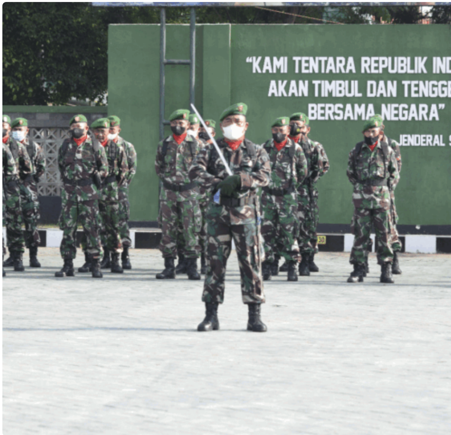
Upacara yang diikuti oleh seluruh anggota prajurit dan PNS jajaran Kodim 0811